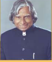
ડૉ. એપીજે અબ્દુલ કલામ ભારતના ભૂતપૂર્વ રાષ્ટ્રપતિ

મને જાણીને આનંદ થાય છે કે “ i Watch ”નું સર્જન ભારતના પરિવર્તનની પ્રવૃત્તિ માટેની નાગરિકોની ચળવળ મારફત થયું છે.