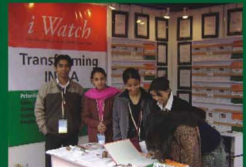
Pravasi Bhartiya Divas, New Delhi, India