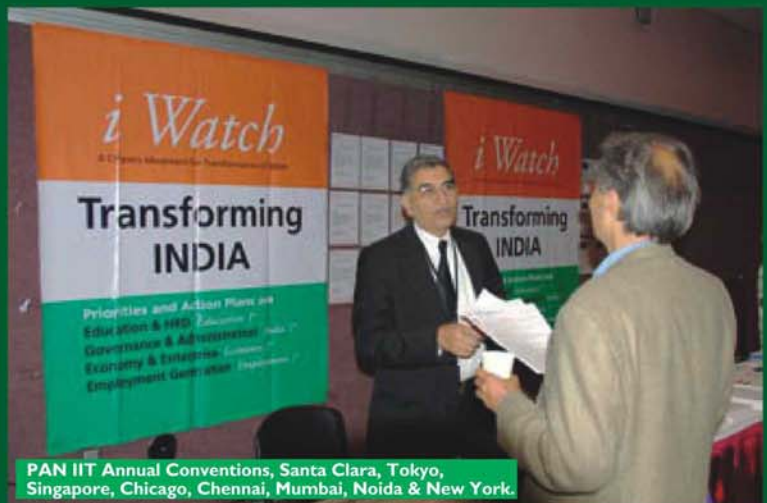
PAN IIT Annual Conventions, Santa Clara, Tokyo, Singapore, Chicago, Chennai, Mumbai, Noida & New York.