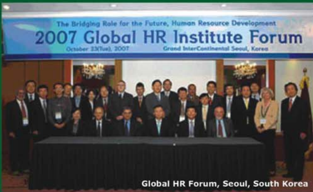
Global HR Forum, Seoul, South Korea